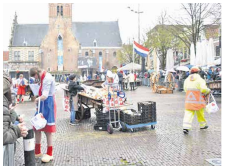
Ortsverband Recklinghausen-Suderwich: Alkmaarer Käsemarkt