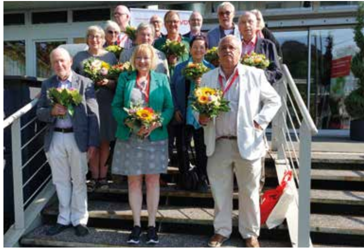
Der neu gewählte Landesvorstand des SoVD Hamburg.