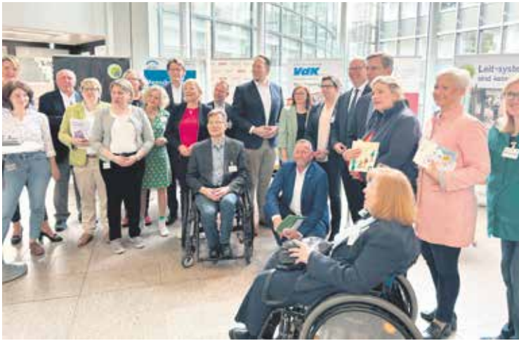
Die Teilnehmer*innen des Parlamentarischen Frühstücks.