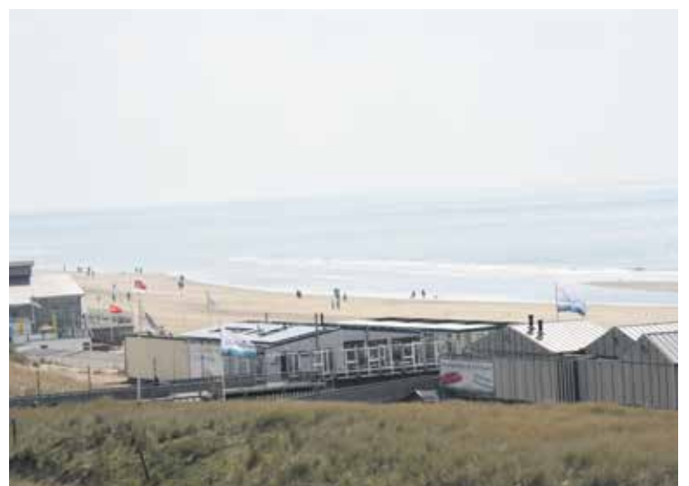
Ortsverband Recklinghausen-Suderwich: Egmond aan Zee