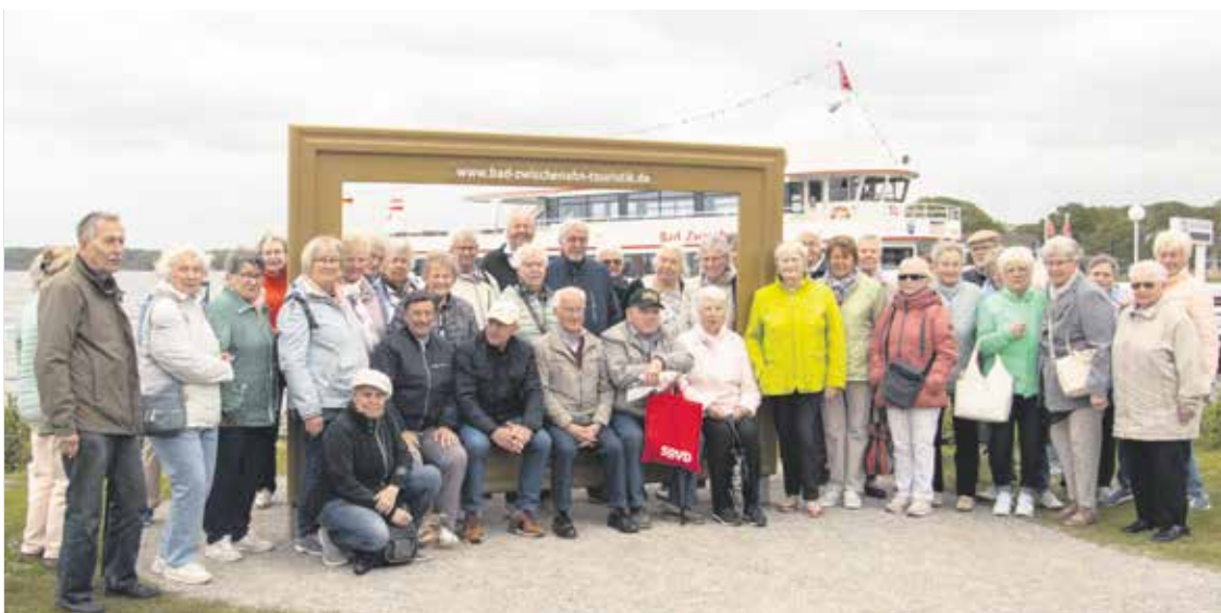
Ortsverband Waltrop: Zwischenahner Meer