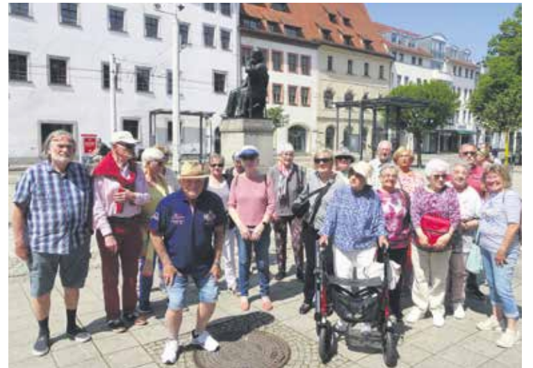
Die Reisegruppe posierte in Zwickau vor dem Robert-Schumann-Denkmal.

Die Besichtigung der Burg Neuenstein, die „kleine Schwester“ der Wartburg und des „Dicken Heinrich“ war leider nicht barrierefrei und damit nicht allen Mitreisenden möglich. Dafür konnten sich alle in Wiehe über eine gigantische Modellbahnausstellung auf 12.000 qm unter dem Titel „Kultur mit Pfiff“ freuen. Verschiedene Regionen Deutschlands, Amerikas und Europas konnten im Kleinformat bei laufendem Zugbetrieb betrachtet werden. Ein Abendessen im „Künstlerkeller“ in Freyburg rundete den Tagesausflug ab.