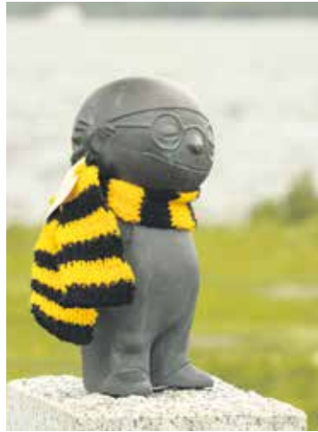
Ortsverband Waltrop: Det