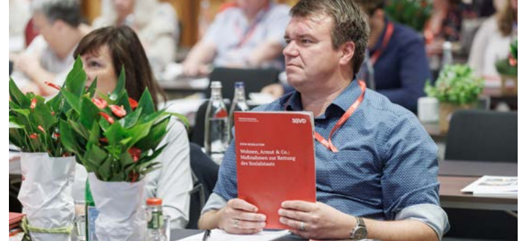
Die Resolution kann auf der Internetseite des SoVD-Landesverbands als PDF-Broschüre heruntergeladen werden.

Auch bei der gerechten Bezahlung, der Inklusion und der Be-