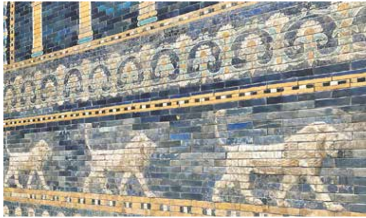
Landesgeschäftsstelle: Das Ishtar-Tor im Pergamonmuseum war eine Sehenswürdigkeit des SoVD-Spazierganges im Mai.

Anlässlich des Europäischen Protesttages zur Gleichstellung von Menschen mit Behinderungen luden der „Arbeitskreis Inklusion der FuMA“ und die „Stif-