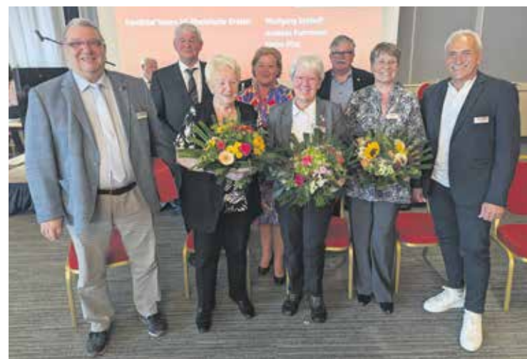
Die scheidenden Vorstandsmitglieder erhielten Blumen.

Die Verabschiedung der „Essener Erklärung“ mit aktuellen sozialpolitischen Forderungen bildete den inhaltlichen Höhepunkt und Abschluss des zweiten Tages. In harmonischer und gelöster Atmosphäre nahmen dann alle Teilnehmer Abschied voneinander und es ging mit einem Lunch-Paket und vielen positiven Eindrücken zurück in die Heimat. Weitere Impressionen von der Landesverbandstagung und einen Film gibt es auf: www.sovd-nrw.de .